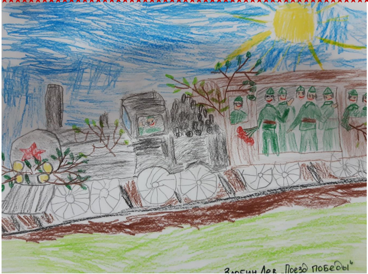
Зимин Лев "Поезд Победы"