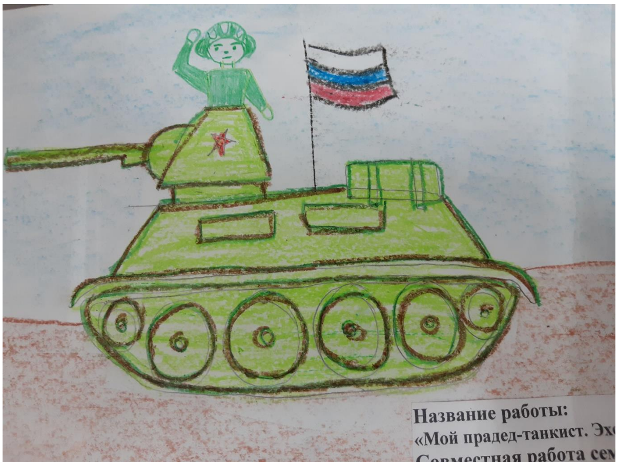
Название работы: «Мой прадед-танкист. Эх» Совместная работа сестры