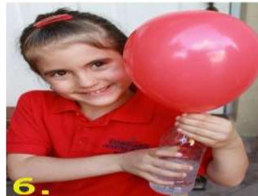
6. Он и наполняет воздушный шарик. Готово!