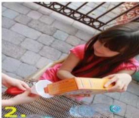
2. В шарик всыпать 5 столовых ложек соды