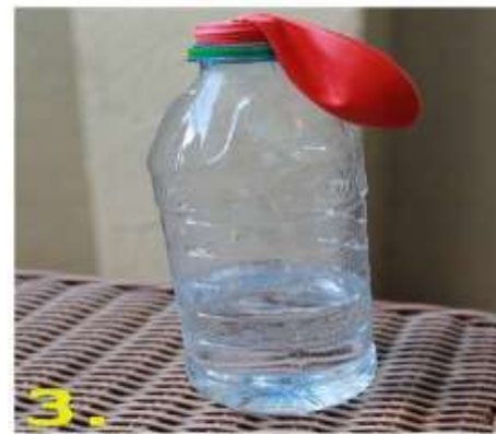
3. Надеть шарик на горлышко бутылки