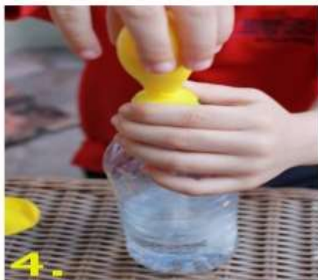
4. Поднять шарик, чтобы сода высыпалась в бутылку