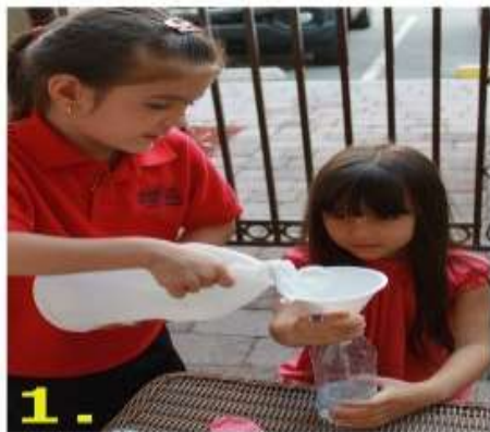
1. Налить полстакана уксуса в бутылку

Как надуть шарик с помощью «гашёной соды»?