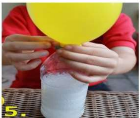
5. При добавлении соды в уксус выделяется углекислый газ