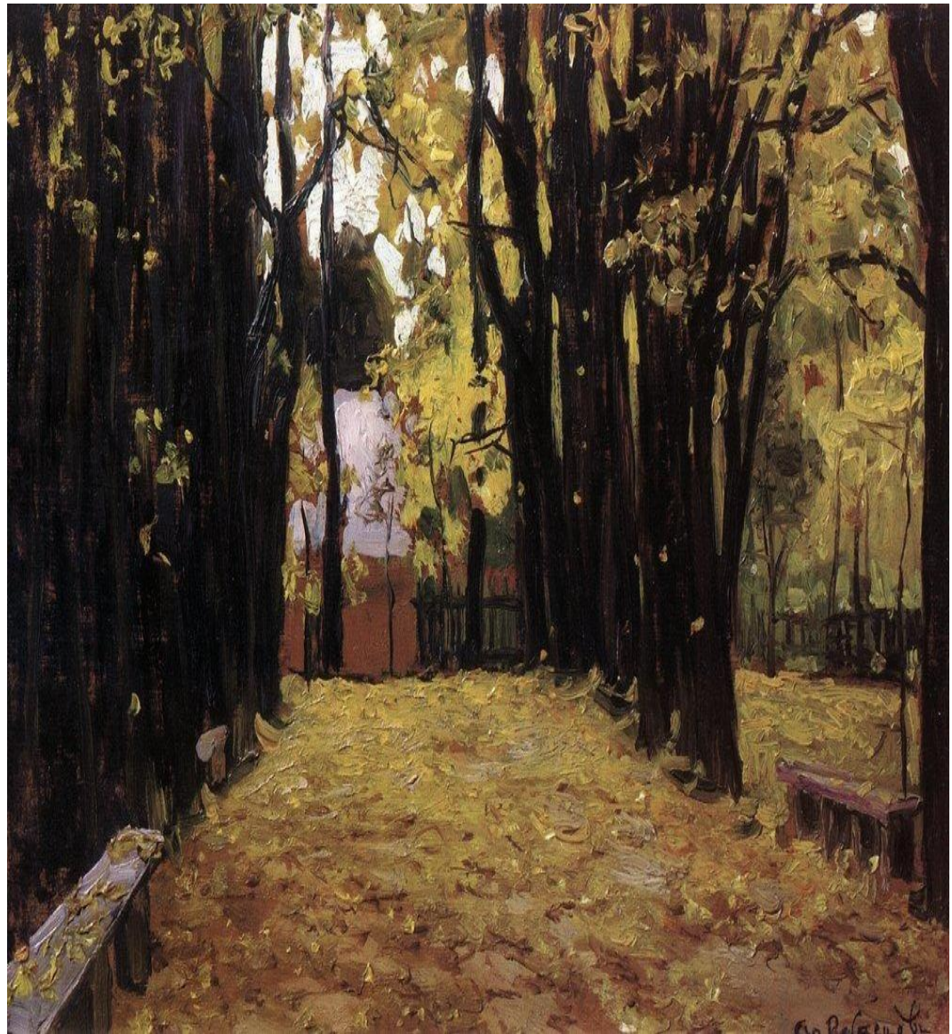
Васнецов А.М. Осень