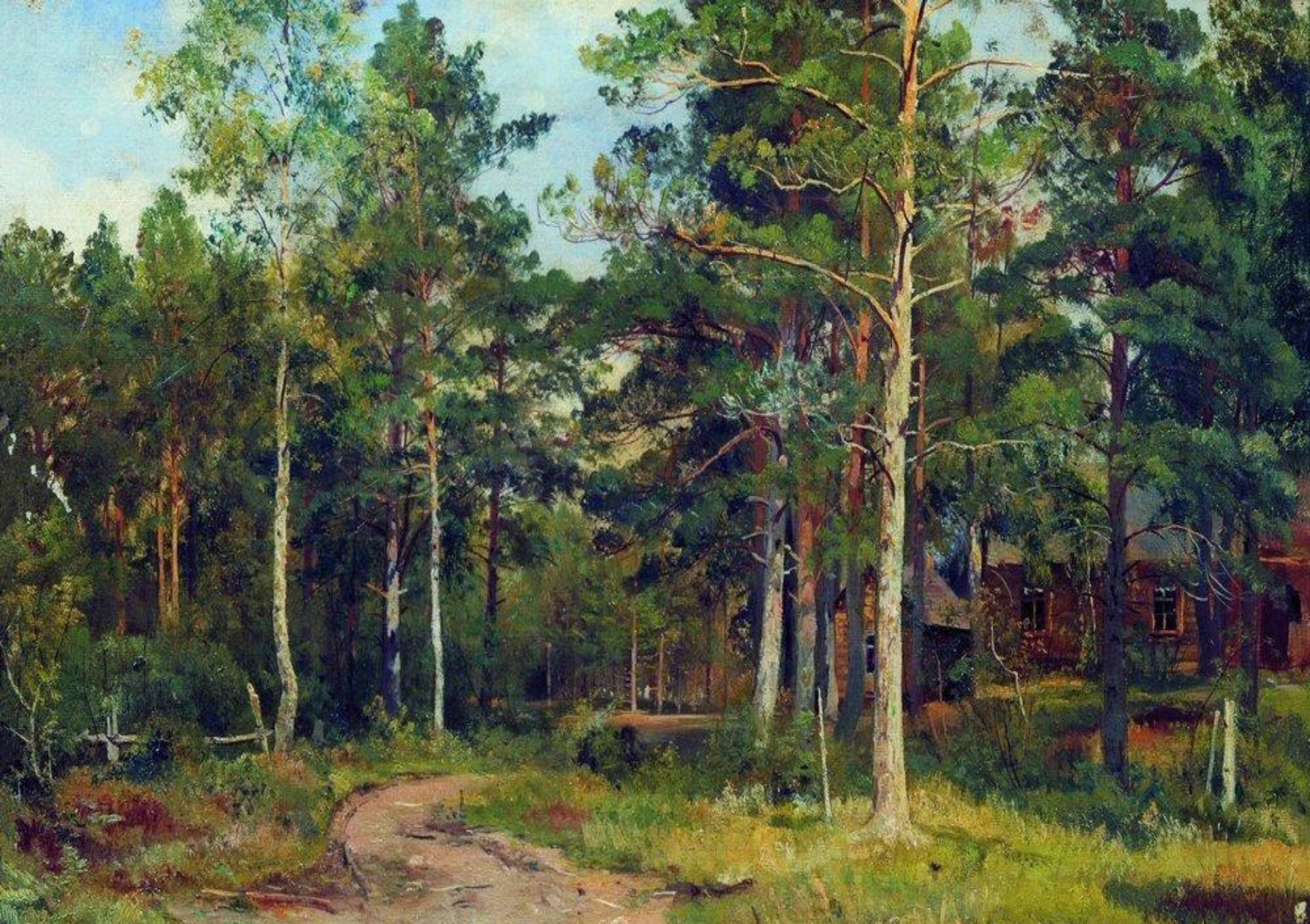
Шишкин И.И. Осенний пейзаж. Дорожка в лесу.