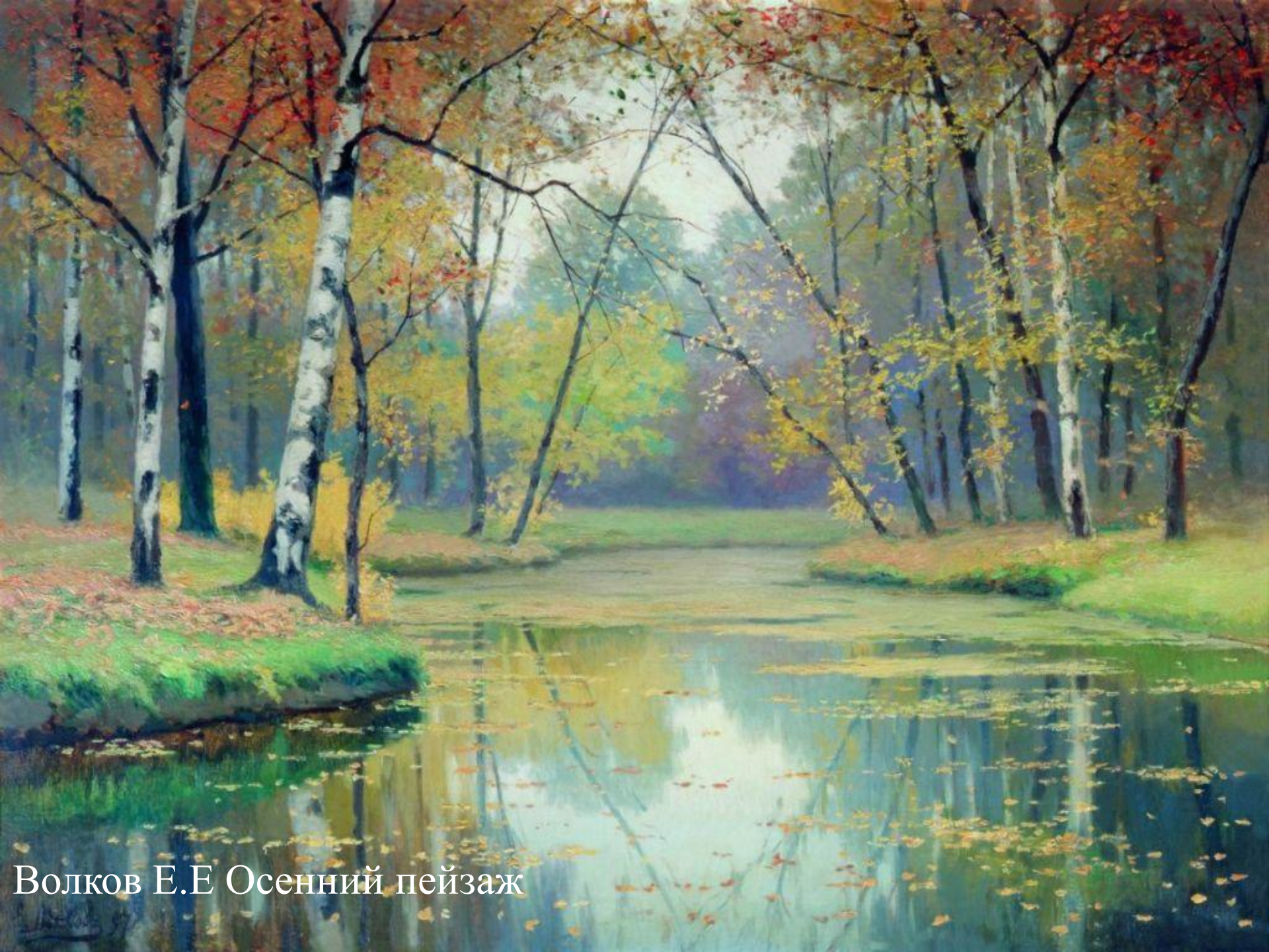
Волков Е.Е Осенний пейзаж