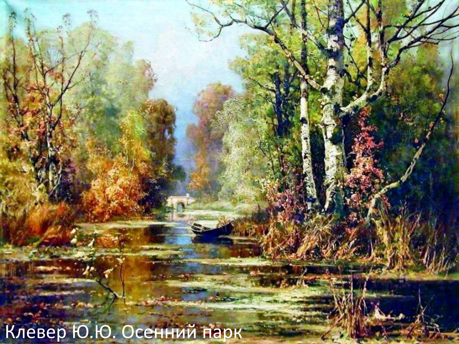
Клевер Ю.Ю. Осенний парк