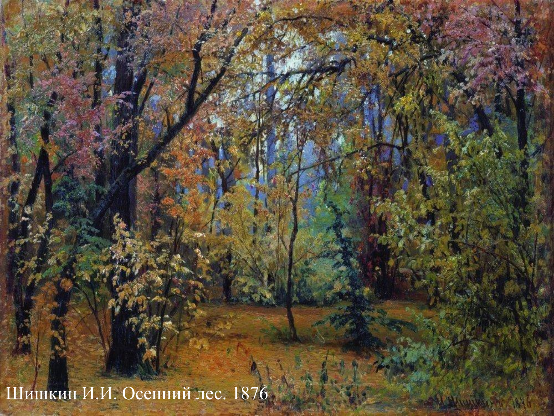
Шишкин И.И. Осенний лес. 1876