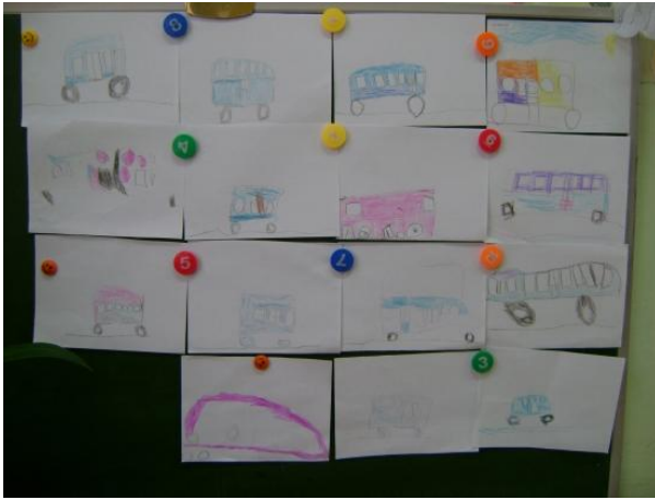
Рисование: «Автобус едет по улице»