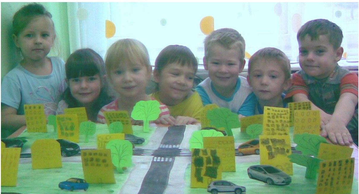
Провели итоговое занятие в группе на тему: «Дорога и пешеход» - сделав совместно с детьми макет по дорожному движению.