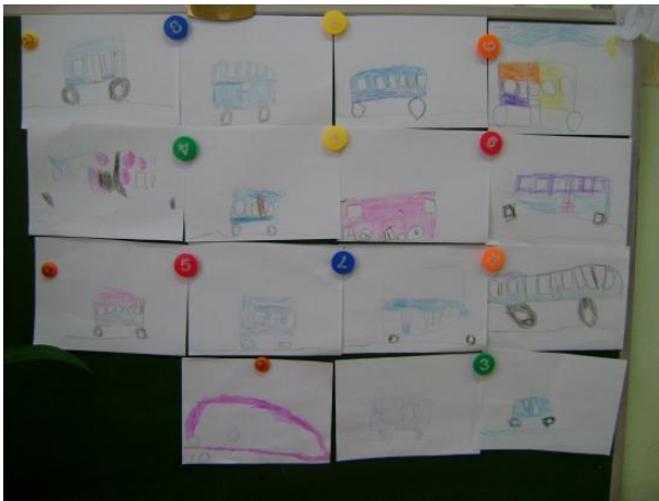
Рисование: «Автобус едет по улице»